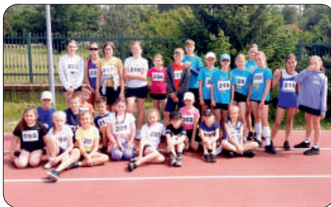
Lekkoatleci z Oleśnicy podczas zawodów LDK w Kielech