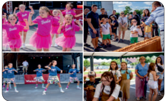
Prezentacje, gry i zabawy z udziałem najmłodszych

kulturalnej społeczności gminnej oraz stanowi formę promocji miejsca, w którym żyjemy i działamy, co zapewne pomoże w zaistnieniu i zauważeniu naszej małej Ojczyzny na mapie świętokrzyskiego szlaku turystycznego .