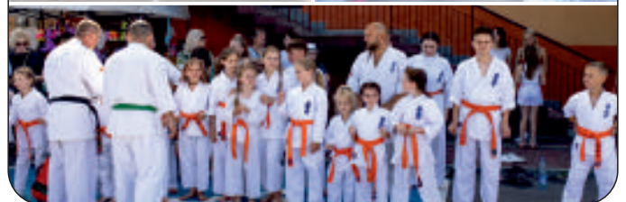
Kolorowy występ przedszkolaków oraz pokaz walk karate