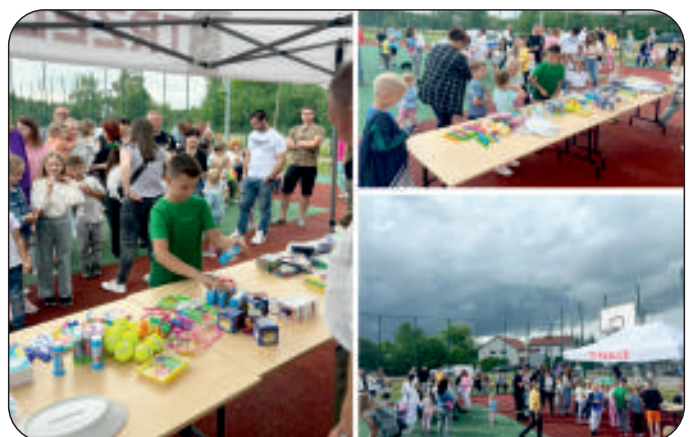
Zabawy, gry podczas pikniku