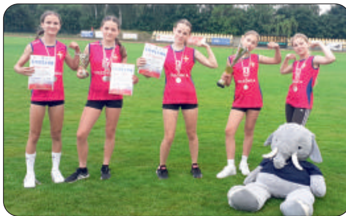
Wieloboistki podczas zawodów wojewódzkich w Staszowie