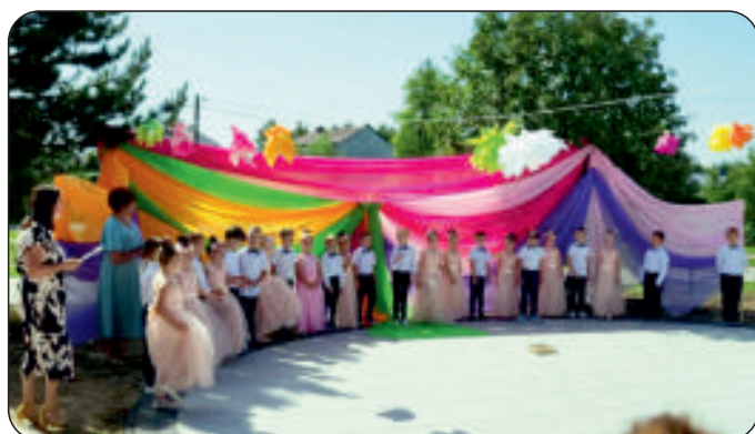
Uroczyste zakończenie roku przedszkolnego