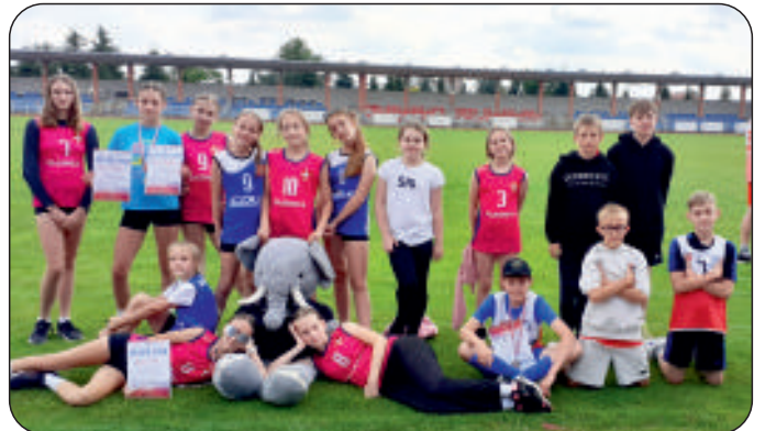
Finał Wojewódzki Lekkoatletyki w Sandomierzu