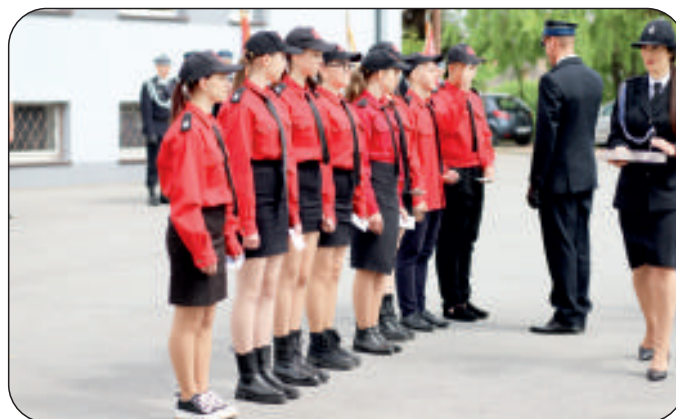
Oleśnicka Młodzieżowa Drużyna Pożarnicza