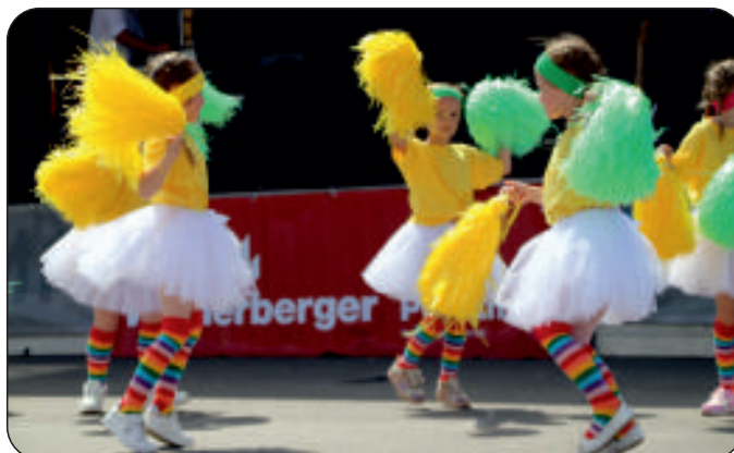
Grupa przedszkolona podczas występów przed szeroką publicznością na „Rodzinnym Pikniku”