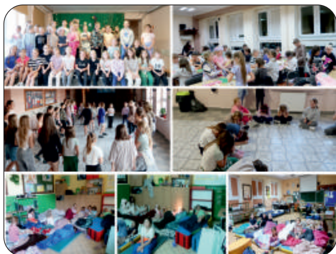
...w bibliotece nie ma czasu na nudę :)