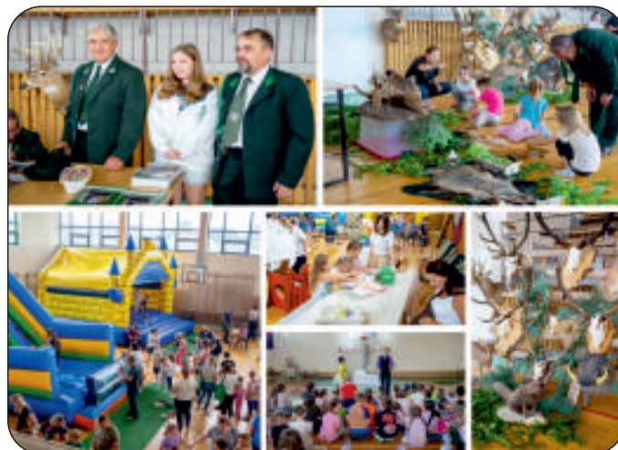
Uczestnicy licznych atrakcji podczas Dnia Dziecka