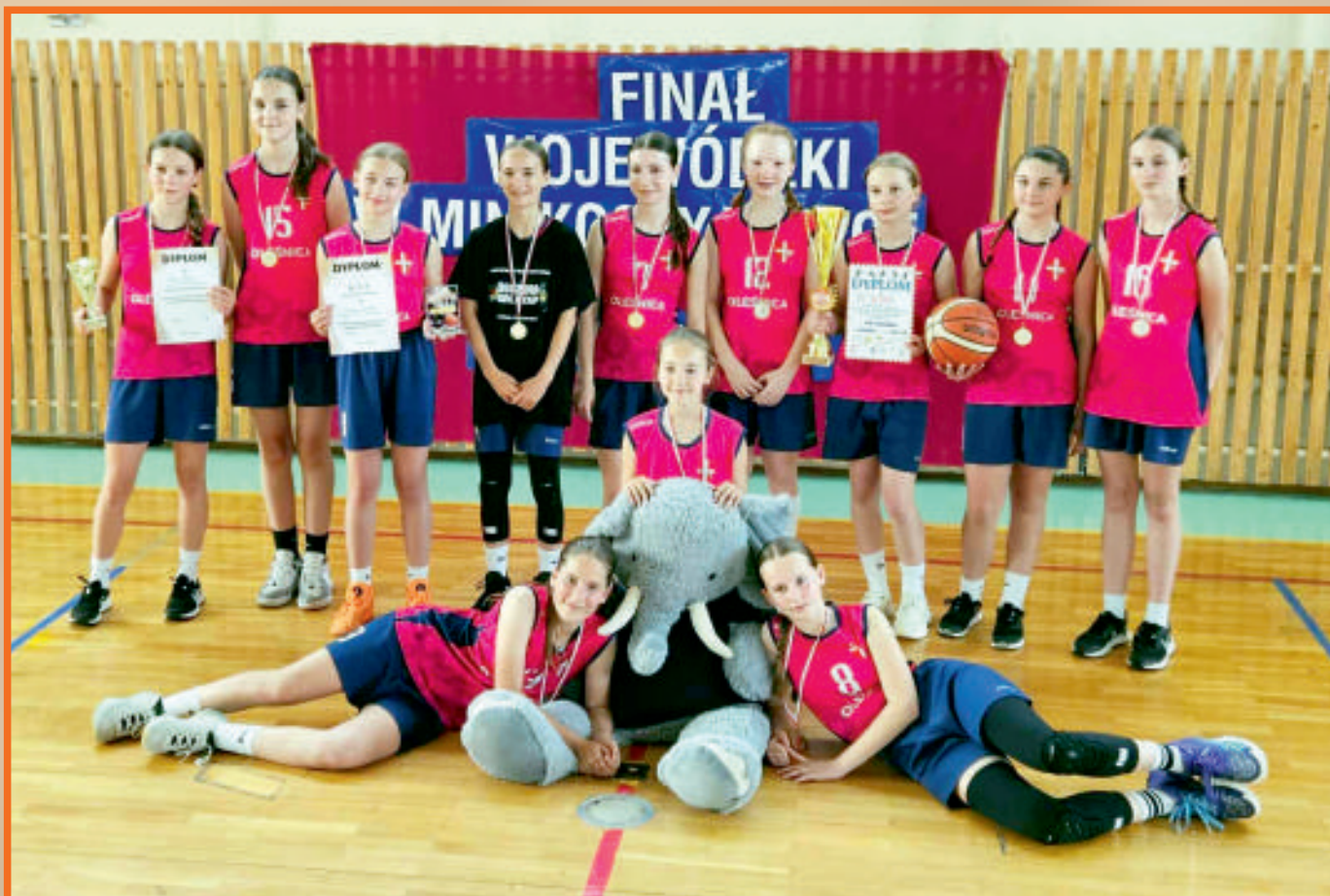
Mistrzynie Województwa w minikoszykówce