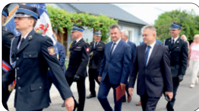
Goście w marszu z kościoła na plac do strażnicy OSP Oleśnica przy ul. Nadstawie