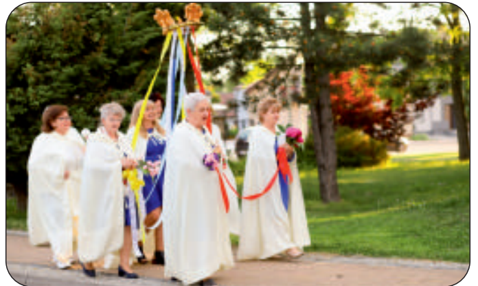
Członkinie Teatru S 65+ z Buska-Zdroju