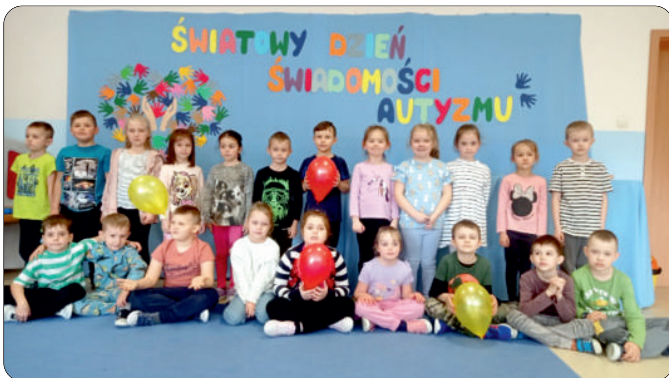
Światowy Dzień Świadomości Autyzmu