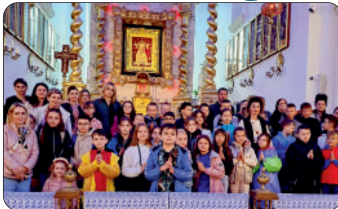
Pamiętkowe zdjęcie uczestników pielgrzymki

Dar pierwszej Komunii Świętej jest niewątpliwym motywem do dziękczynienia za ten „Cudowny Pokarm Duszy”. I właśnie w akcie wdzięczności rodzice, wraz ze swoimi pociechami, wybrali się na pielgrzymkę. Tegorocznym celem naszej duchowej wyprawy były dwa sanktuaria położone na świętokrzyskiej ziemi. Miejsca, gdzie bez wątplenia człowiek wierzący odczuwa bliską obecność swojego Stwórcy. Pierwszym z nich był Kałków-Godów – jeden z najmłodszych ośrodków kultu Maryjnego w Polsce. Tam też, przed słynącym łaskami obrazem Matki Bożej, Bolesnej Królowej Polski, Matki Ziemi Świętokrzyskiej, wspólnie pokłoniliśmy się Maryi prosząc, by orędownała za nami u swego Syna – Jezusa Miłosiernego. To nasze spotkanie z Mamą miało swój nadrzędny cel. Jego zamierzeniem była pomoc w zrozumieniu oczywistej prawdy, że wszyscy w życiu poszukujemy szczęścia, ale to szczęście jest wtedy, kiedy jesteśmy blisko Pana Jezusa i Jego Matki. Bo jak mówi stare przysłowie: „Kto z kim przestaje, takim się staje”. Podczas wpatrywania się w oblicze Maryi, na niezwykle skupionych twarzach uczestników pielgrzymki, szczęście malowało swój uśmiech. Zapewne w kierunku niebios popłynęło wówczas wiele modlitw. Nietrudno się