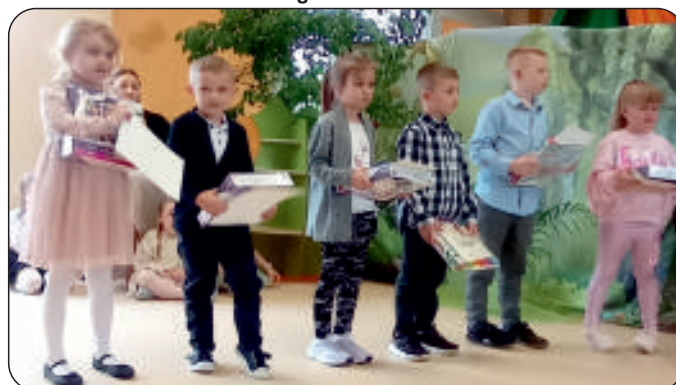
Zwycięzcy i laureaci konkursu