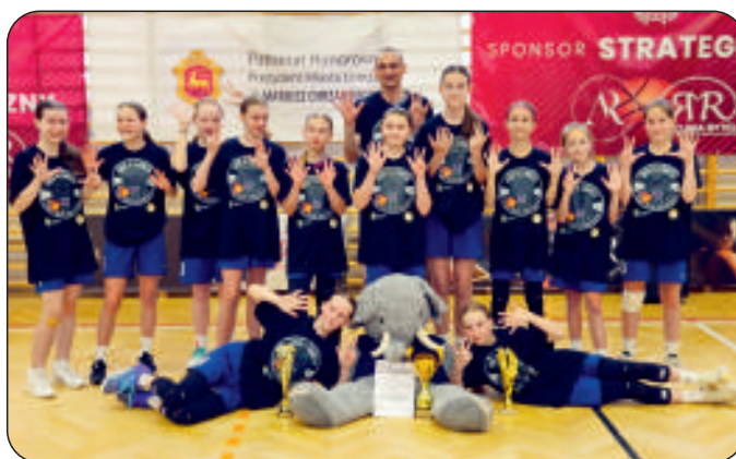
Finał Ogólnopolski Młnikoszykówki Dziewcząt - Łomża' 24