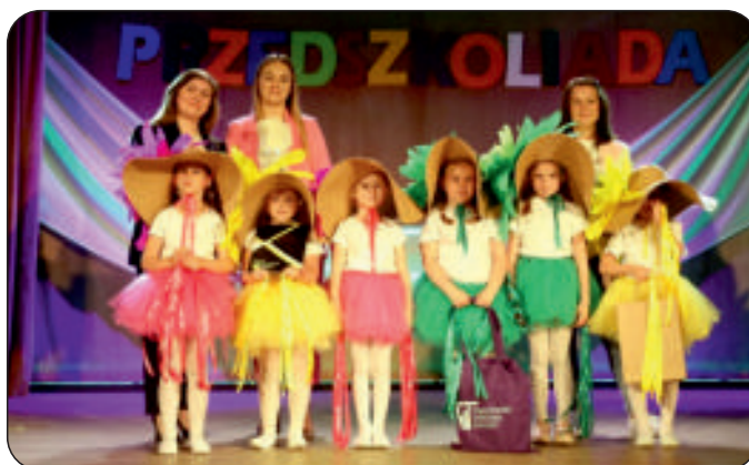
Występ oleśnickich przedszkolaków na scenie Staszowskiego Centrum Kultury podczas „Przedškoliady”