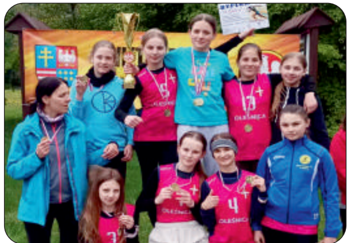
„Złotka” w drużynowych biegach przełajowych w Rytwianach