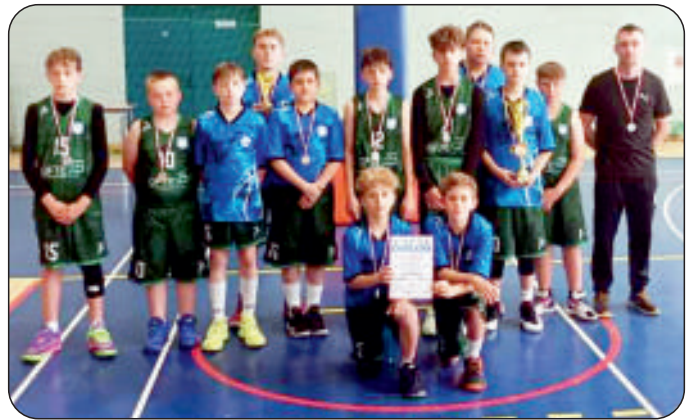
Drużyna koszykarzy PSP w Oleśnicy