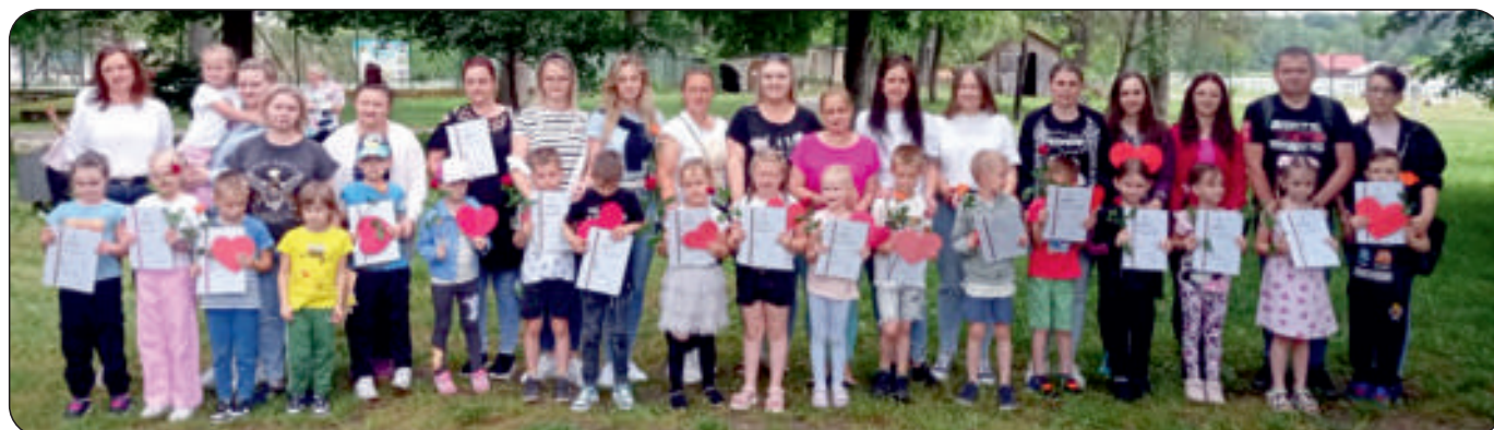
Pamiątkowe zdjęcie przedszkolaków z rodzicami z okazji „Dnia Matki”