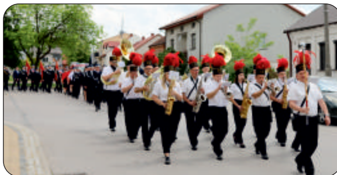
Korowód uroczystości prowadzi Orkiestra Huty Szkła Tadeusza Wrześniaka