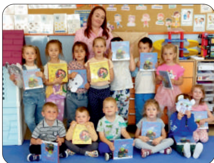
„Cała Polska” czyta dzieciom