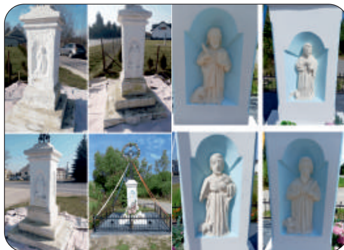
Figura przed i po renowacji