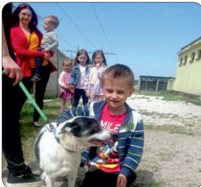
... podczas spotkania w schronisku