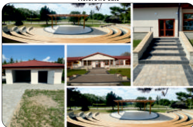
Amfiteatr z widownią