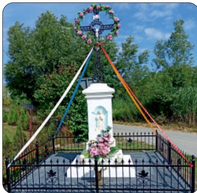
Obecny stan figury