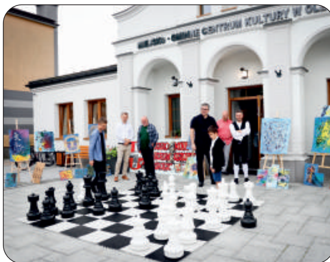
Nietuzinkowe potyczki szachowe przed budynkiem MGCK