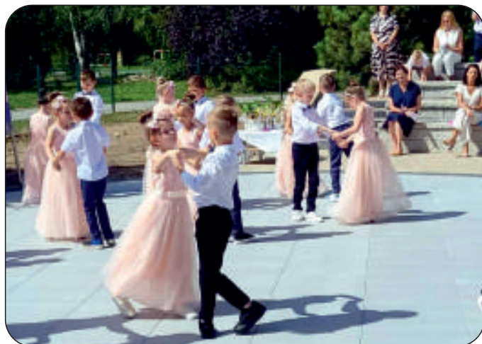
Uroczyste zakończenie roku przedszkolnego w artystycznym tańcu