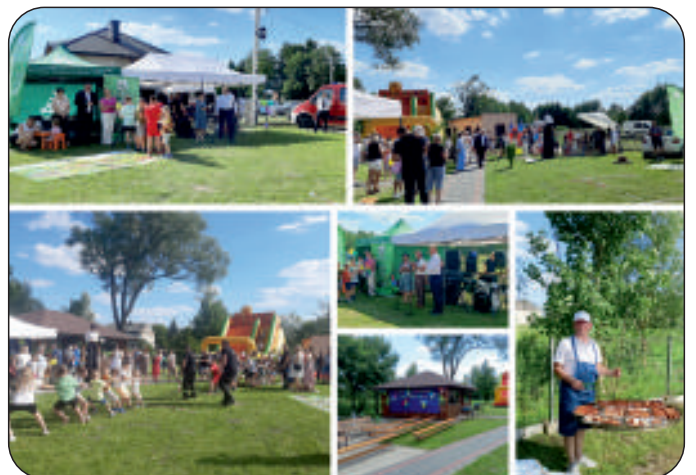
Atrakcje podczas letniej imprezy