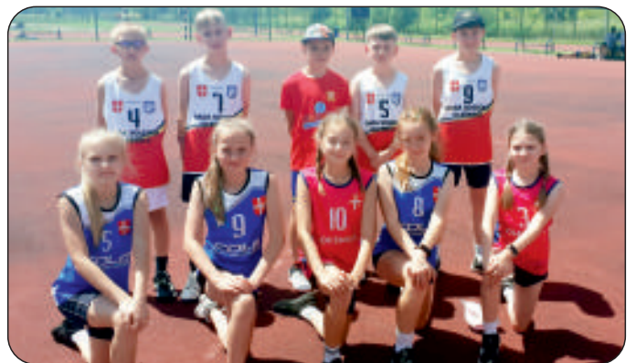
Czwartaczki podczas finału trójboju