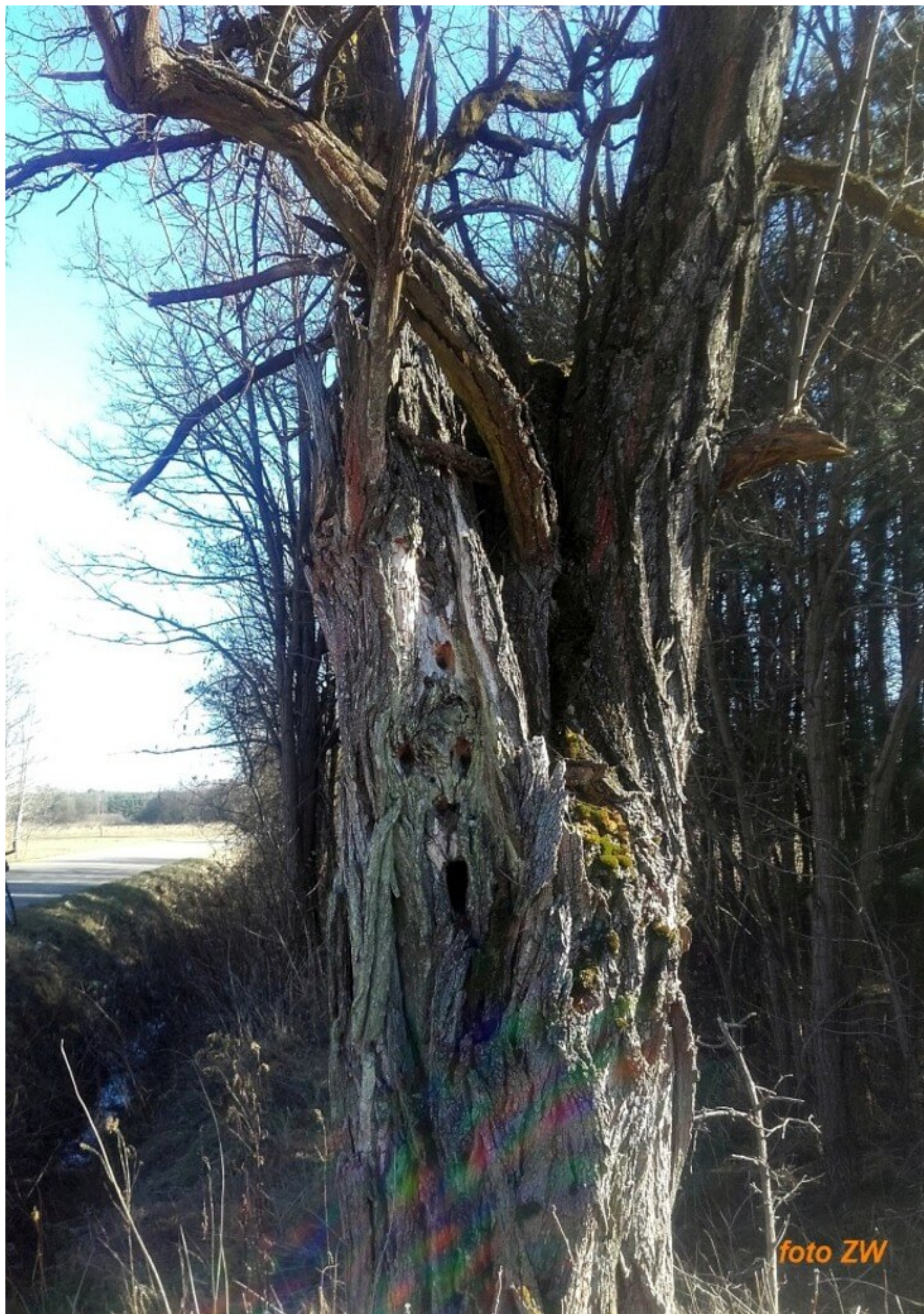
Fot. 5. Wierzba z twarzą [caption] [caption id="attachment_17887" align="aligncenter"]