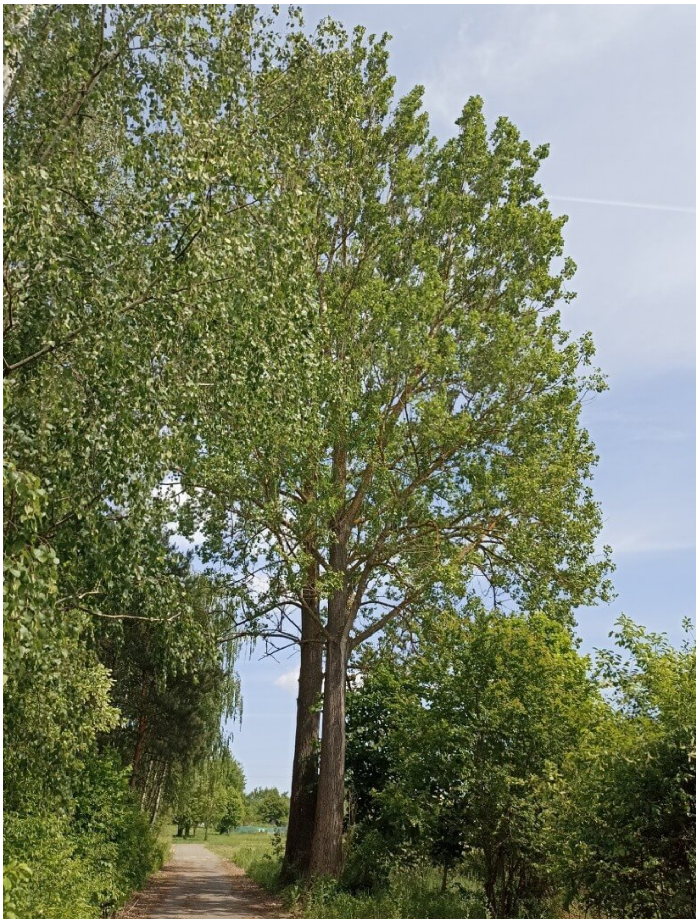
Fot. 6. Topole czarne w Oleśnicy[/caption]

Dla osób ciekawych poznania okolic należy wspomnieć także o ciekawostkach dotyczących miejsc