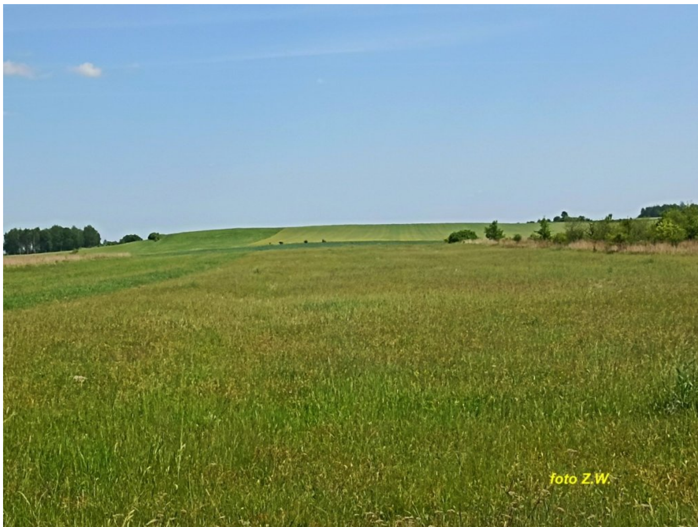
Fot. 7. Widok na Górę Borzymowską (od strony Oleśnicy)[/caption]