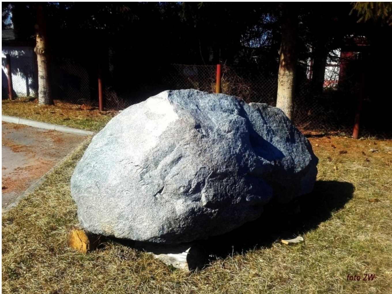
Fot. 3. Głaz narzutowy - Strzelce [caption]

[caption id="attachment_17890" align="aligncenter" width="900"]